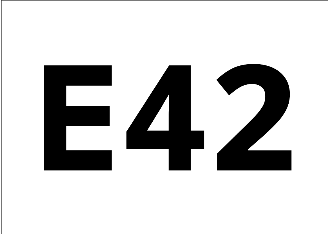
Abbildung 3 Die Kennzeichnung der Sitzplätze (bspw. Nummer E42) befindet sich auf der Tischplatte oder der Fläche vor dem Sitzplatz. Es handelt sich um aufgeklebte Papierblätter im Format DIN A4 oder DIN A5, die nach der Sitzung beseitigt werden.